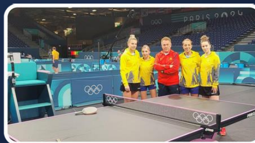
Lotul olimpic de tenis de masă Paris 2024