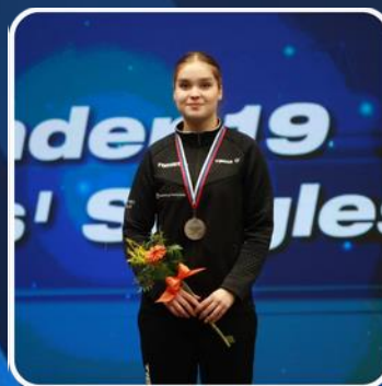
Elena Zaharia Campionă europeană U21 2022 Cluj-Napoca