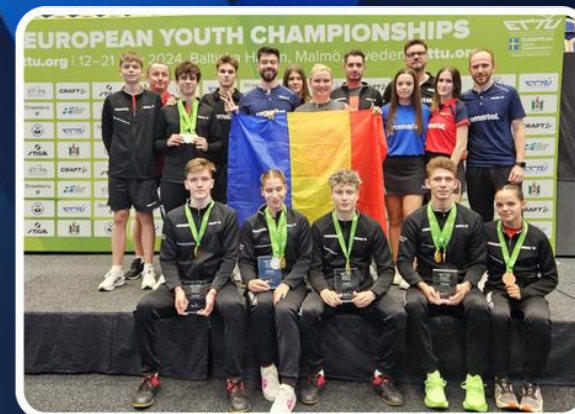
2024 Campionatul European Juniori 4 medalii de aur 3 medalii de argint 4 medalii de bronz