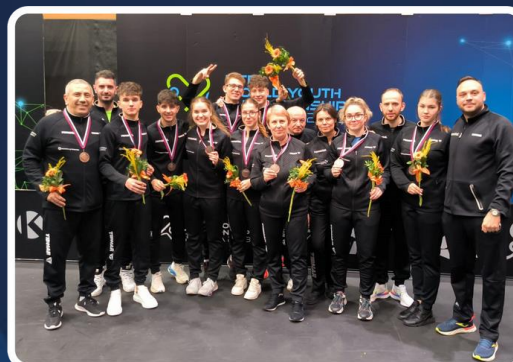
2023 Campionatul Mondial Juniori 1 medalie de argint 3 medalii de bronz