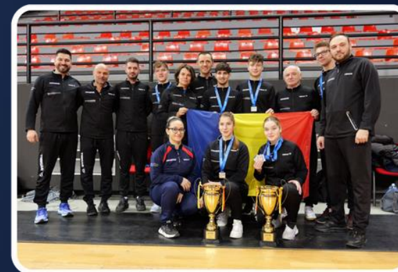
2024 Campionatul European U21 1 medalie de aur 4 medalii de argint 1 medalie de bronz