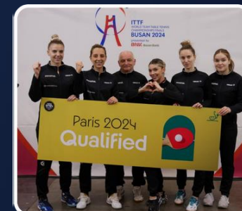
Lotul olimpic de tenis de masă Paris 2024