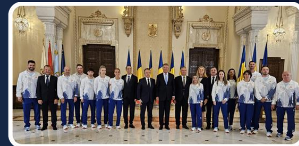
Lotul olimpic de tenis de masă Paris 2024