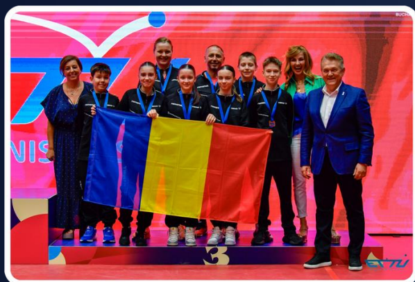
2024 Campionatul European U13 3 medalii de bronz Simplu feminin, dublu mixt, echipe mixt